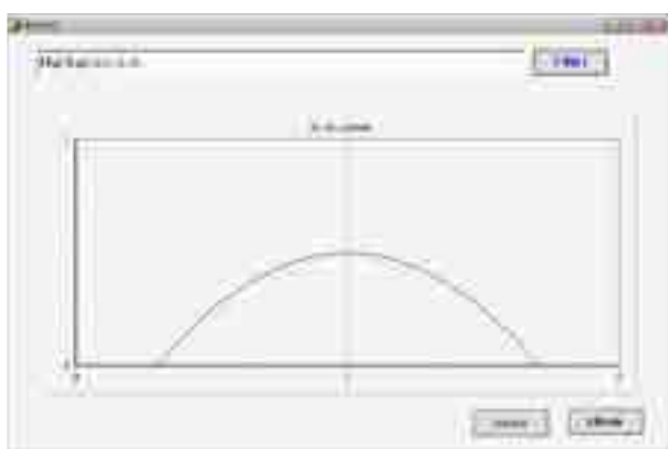
2-чизма. Жиноятга мойилликнинг тегишлилик функцияси

Жиноятга мойиллик даражаси худди шу таҳлилда барча аҳоли ёш гуруҳи қатламлари учун шакллантириб олинади.