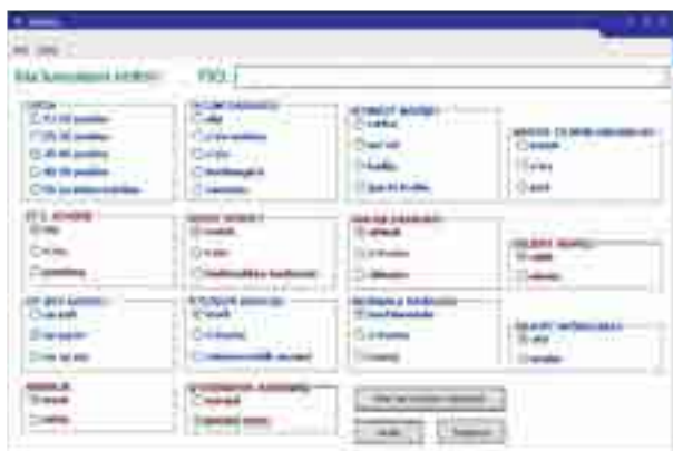
1-чизма. Шахс ҳақидаги маълумотларни тўлдириш (анкета-сўров кўринишида)

Дастурий восита аҳоли вакилларини базага киритиш ва уни ўзгартириш жараёнидан бошланади ва мос равишда индивидуал криминоген тегишлилик ва аҳоли гуруҳи криминоген тегишлилиги ҳисобланади, қолаверса, визуал тасвири тегишлилик функцияси кўринишида акс эттирилади (1-2-чизмалар):